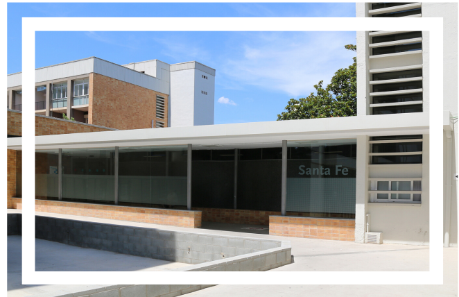
Edificio Santa Fe