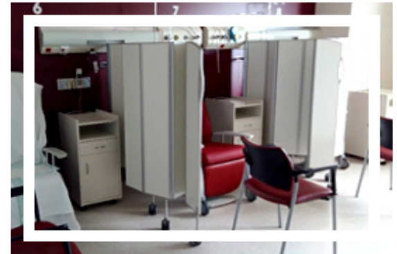
Edificio Taulí - Hab. 307-308

En el momento del ingreso para intervención debes presentarte: